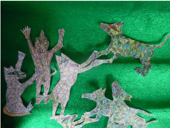
Wolfsanbetung in Blau und Grün