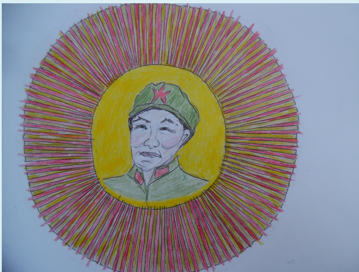
Die rote Seele des blauen Sterns

Das steinerne Herz dieser Roboter-Welt, in der die Menschen aus Stahl und ohne Mitleid sind, ist Israel.