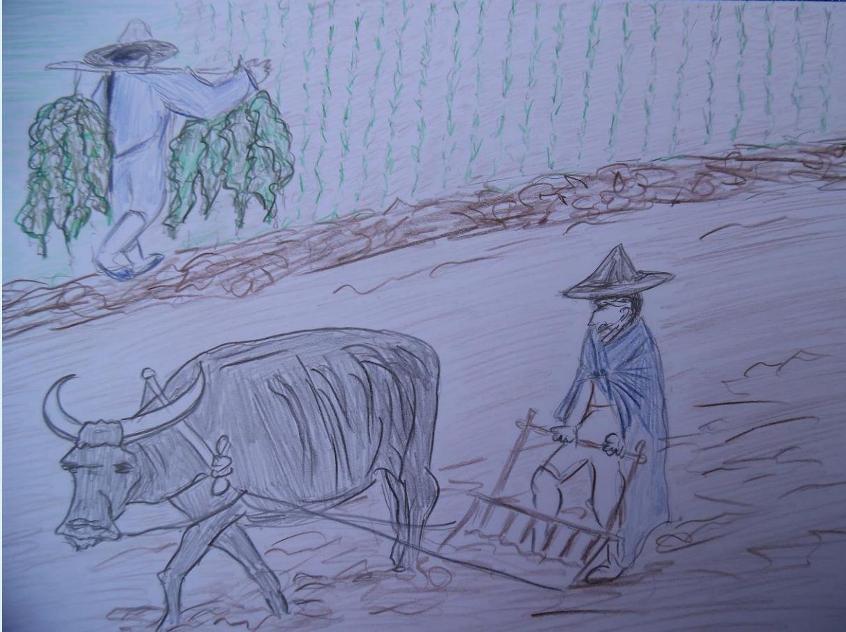
Vorlage aus dem Internet (google- Bilder)