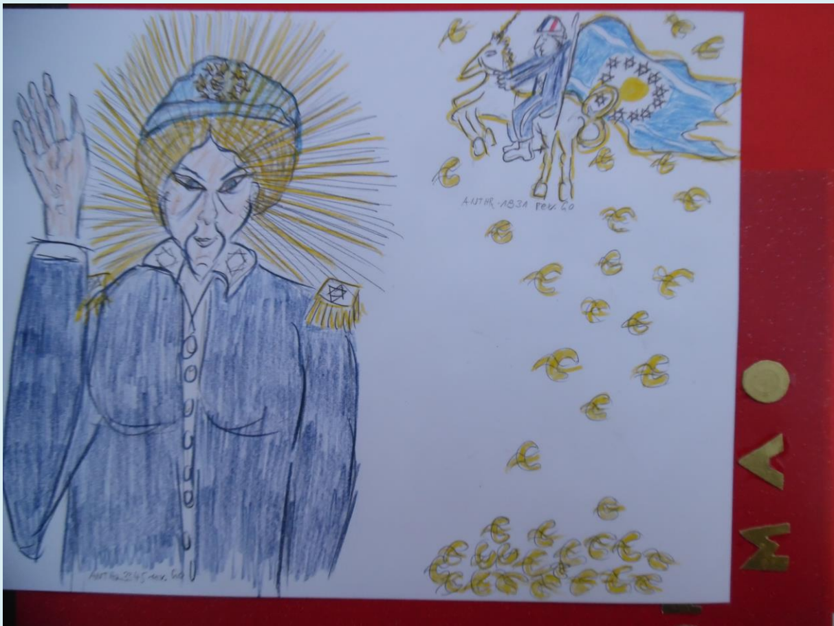
Maman und Macron: Rotgardisten im blauen Staatsgewand

Zwischen 2018 und 2025 verwandelt sich Europa in eine Hölle auf Erden.